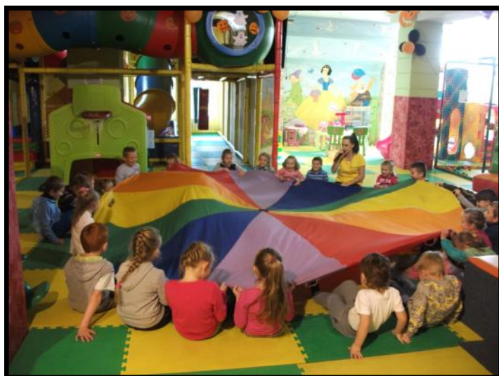
Zabawy z chustą animacyjną

Po dłuższych przemyśleniach w końcu 28 października przedszkolaki oraz chętni z klas I-III wyjechali na upragnioną wycieczkę do „Kulkolandu” w Dębicy. Na miejscu czekała na nas miła Pani, która prowadziła z nami zabawy przy pomocy chusty animacyjnej. Bawiliśmy się wyśmienicie pokonując wszystkie wspinaczki, zjeżdżalnie, baseny kulkowe. Po kilkudziesięciu minutach zasiedliśmy do słodkiego poczęstunku. Kolejną atrakcją przygotowaną przez Panią animator było przeciąganie liny, zawody oraz zagadki. Gdy nasz czas zabaw zakończył się wszyscy byli bardzo zawiedzeni, ale obiecali, że przyjadą do „Kulkolandu” za rok.