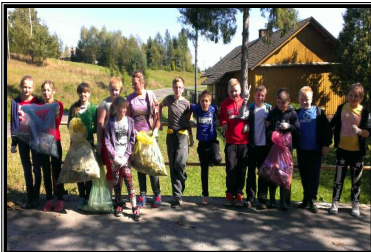
Klasy V i VI sprzątają świat