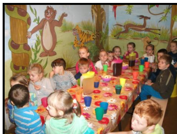
Poczęstunek w przerwie pomiędzy zabawą