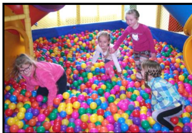
Dziewczynki w basenie kulkowym