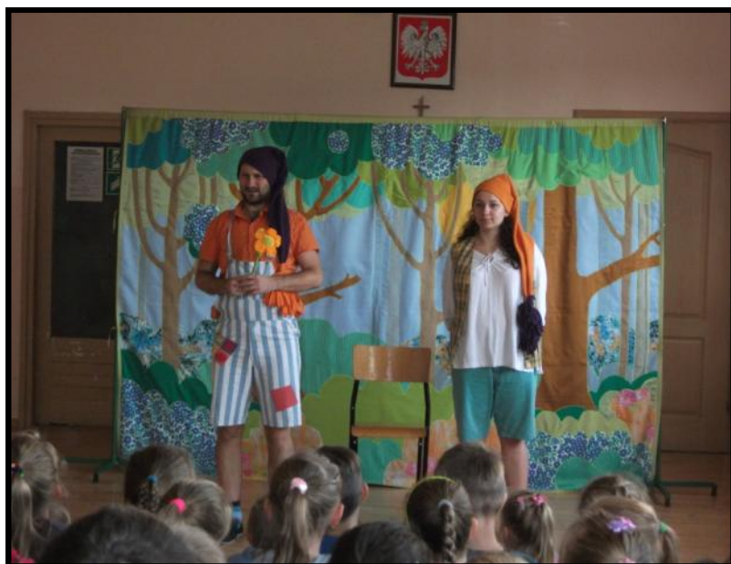
Krasnale: Baltazar i Trucuś

król kazał znaleźć kwiat o nazwie „Bieluń”, aby wypędzić nietoperze. Teatrzyk ten nauczył nas, abyśmy nie myśleli, że skarbem są tylko pieniądze, ale rzecz na której nam bardzo zależy np. przyjaźń. Przedstawienie to było piękne, zabawne, wesołe oraz pouczające. Wszystkim uczniom bardzo, ale to bardzo się spodobało.