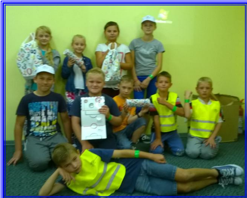
Uczniowie, którzy otrzymali nagrody