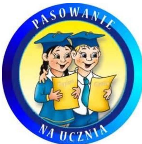
Pierwsza klasa podczas akademii