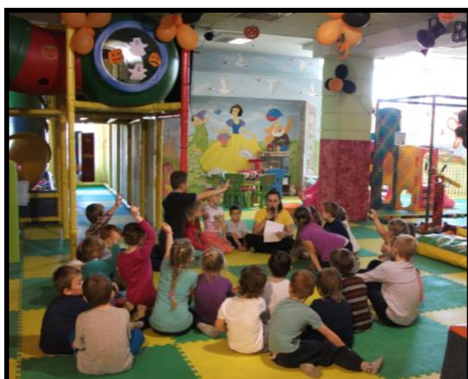
Dzieci rozwiązują zagadki